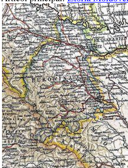
Harta Bucovinei din anul 1901